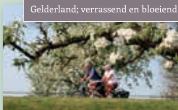
Gelderland; verrassend en bloeiend!