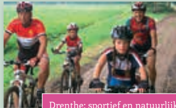
Drenthe; sportief en natuurlijk!