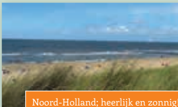
Noord-Holland; heerlijk en zonnig!