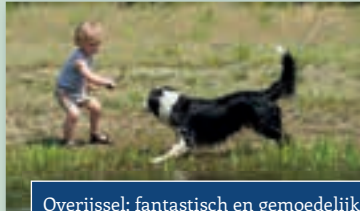
Overijssel; fantastisch en gemoedelijk!