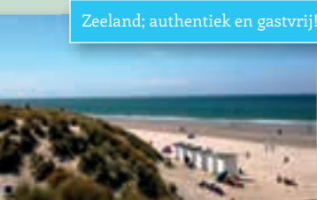
Zeeland; authentiek en gastvrij!