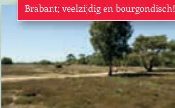
Brabant; veelzijdig en bourgondisch!