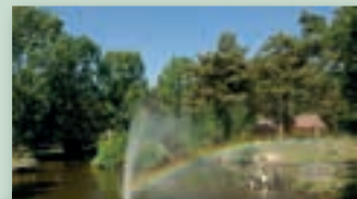
Limburg; onvergetelijk en mooi!